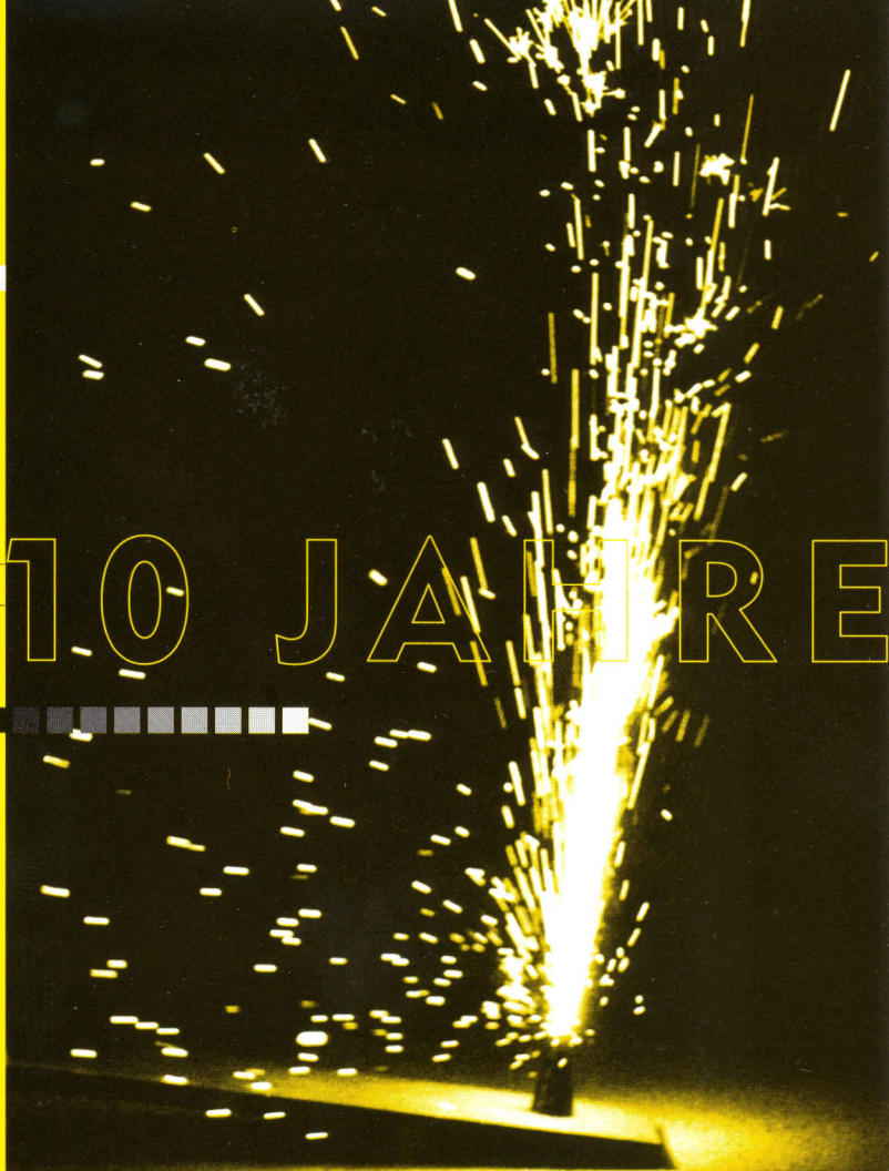
FOTOGRAFIE: Von Peter Maier aus dem Bilderzyklus «Vanitas» (1988)