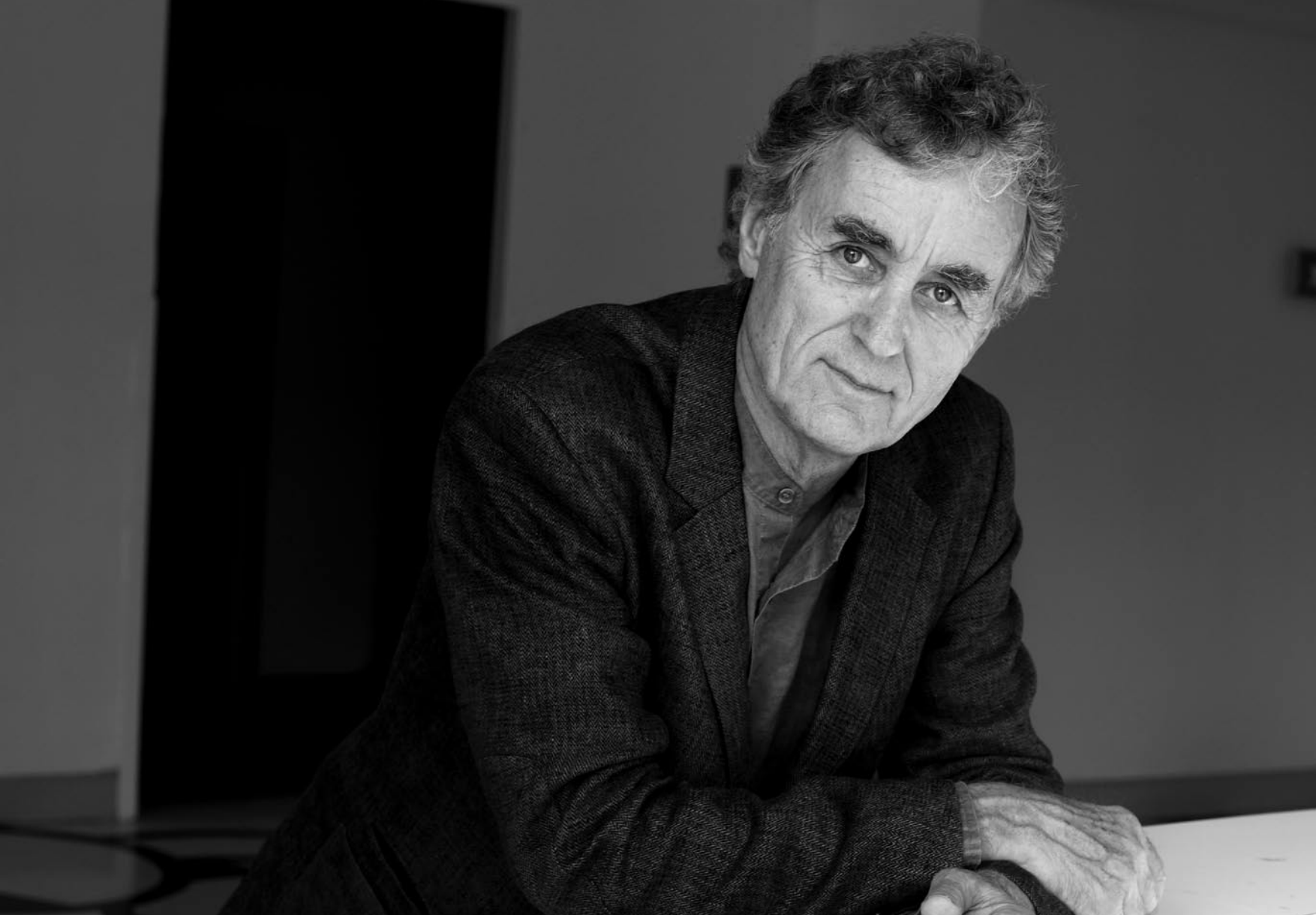
Fritjof Capra [70] glaubt, dass der Übergang ins Solarzeitalter nun endlich im Gange ist.

Angesichts der handfesten Probleme auf dieser Welt wie Hunger, ungleiche Ressourcenverteilung, Kriege, Fundamentalismus müsste man eigentlich zum Pessimisten werden. Es gibt keine gerechtere oder nachhaltigere Welt, auch wenn sie in Büchern und Vorträgen immer wieder postuliert wird. Sehen Sie das anders? Ich sehe heute zwei sehr unterschiedliche Entwicklungen, die sich entschieden auf das Wohlergehen und die Lebensweisen der Menschheit auswirken werden. Die eine ist der Aufstieg des globalen Kapitalismus; die andere ist die Erschaffung nachhaltiger Gemeinschaften, die auf der Umsetzung des Ökodesigns basieren. Diese beiden Szenarien, die jeweils mit komplexen Netzwerken und neuen Technologien zu tun haben, befinden sich derzeit auf einem Kollisionskurs. Das Ziel der globalen Wirtschaft ist die Maximierung von Reichtum und Macht ihrer Eliten; das Ziel des Ökodesigns ist die Optimierung der Nachhaltigkeit des Lebensnetzes. Wir besitzen heute das Wissen, die Technik, und die finanziellen Mittel um eine nachhaltige Zukunft zu gestalten. Was wir dringend benötigen, ist politischer Wille und Leadership.